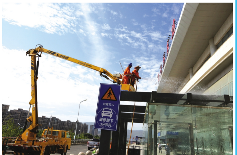
自创卫工作以来,华茂公司始终站在园区创卫活动的最前沿,在做好辖区内环境卫生突击整治等创卫工作的前提下,还帮助园区相关单位处理创卫工作的“难题”。日前应连云港东站“求援”,调派路灯维护升降车、洒水车等机械车辆和多名职工帮助清洗火车站栈桥出口通道玻璃走廊上的污物。(张青松)

成立创卫工作领导小组、创卫工作办公室、创卫工作宣传小组,先后制定创卫工作实施方案和创卫工作宣传工作方案,安排人员与集团对接,确保民爆公司基础建设、管理服务水平和企业面貌得到全面提升。创卫办公室对公司办公楼及院子进行划分,实行卫生责任制,责任到人,不留死角。 公司工会会同创卫办公室根据前期排查出的突出问题,全面实施创卫工程。一是将使用多年的开放式垃圾池拆除,更换为活动垃圾桶,便于及时清理,脏乱状况大为改观。二是购买捕鼠笼、粘鼠板和粘蝇板并安放到位,进行“四害”消杀工作。三是组织员工针对性的对车库及院子进行彻底扫除,清理废旧物品,清除院内积水青苔,使创卫工作扎实的落实到位,公司环境卫生得到进一步提升。(民爆宣)