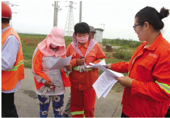
为提高广大女职工的法律素质,增强女职工权益保护意识,6月1日上午,徐圩悦升公司工会开展“普法到一线、宣教进基层”活动,将《女职工权益保护法》、《劳动法》、《全面二胎》等与女职工密切相关的法律政策影印成册,发放到一线女工手中。(戴月婷)

“中秋”、“国庆”假期即将到来,房地产公司早安排、早部署,采取“四项措施”,确保生产、过节“两不误”。 强化安全生产工作。组织节前安全生产大检查,落实各项安全措施,共排查安全隐患13起,整改12起,1项在整改中。 做好和谐稳定工作。公司强化排查,对矛盾纠纷认真对待,提前介入,及时化解;开展惠民暖心和文体活动,丰富员工的节日生活。 合理组织安排生产经营工作。抓好销售,提前为商品房“金九银十”市场暖场,确保两个楼盘清盘和建材市场供应;抓好管理,加大欠款回