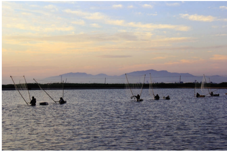
临近两节，青口投资公司养殖户抢抓节日市场，东方对虾大量起捕上市，为港城人民再添节日大餐。当前，青口公司共有水产养殖面积近2万亩，全年对虾销售量预计超70万斤。(青宣)