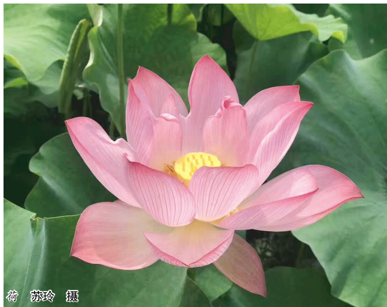
荷 苏玲 摄

命运不是我能选择,但责任我必须肩负;结局不是我能把握,但努力我必须付出。如果每个人心里都装着责任、义务和奉献,都在平凡的岗位上实现最大的价值,那么,无数个平凡就汇聚成了伟大。我们憧憬火热的事业,渴望人生的成功,实现人生的价值,那么,就让我们携起手来,在平凡之中奏响生命的乐章!