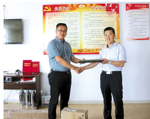
为进一步推动全市创建全国文明城市工作深入开展,加强上下联动,形成整体合力,供电公司与海州区洪门村签订联动共建协议,建立定期联络制度,援建文化活动中心和文化墙,并帮助其进行路灯的维修维护。(电宣 电工)