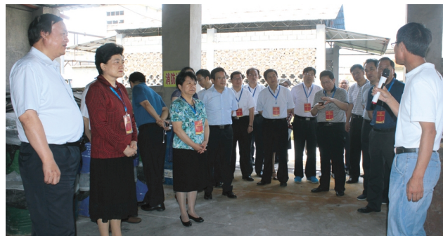
7月10日上午,连云港市人大常委会常务副主任、党组副书记杨莉,副主任于丽华带领部分人大代表在副市长徐家保的陪同下,围绕我市“263”专项行动推进情况到双菱化工公司调研视察,对该公司下一步转型工作提出了相关意见和建议。(双菱宣 工宣)