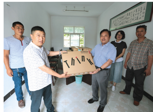
7月7日上午,华茂绿化工程公司将广播设备、办公电脑等器材送到联动共建单位云台街道山东村,这是该公司落实“市创建全国文明城市”联动共建协议签订后又一切实举措。双方表示要定期联络,密切配合,确保联动共建工作取得实效。(张青松)

一是瞄准目标,强化考核。制定完善《年度经营绩效考核办法》,按月按季依实绩考核兑现,推进目标任务完成。二是加大项目推进。立足杜钟氨纶消防水池、神特新材料公司厂房、徐圩幸福家园土建等项目,加快在建项目施工竣工决算进度,确保完成收入与利润目标。三是高度重视工程精细化管理,科学制定进度计划,施工人员放弃节假日,争分夺秒赶工期,加班加点奋战在一线,控制成本,提高工程利润率。四是通过试行建筑工程自营模式,建立了广泛的技术、管理、材料、劳务、设备等渠道,使得公司的施工管理和成本控制能力得到了实质性提升,为泰运公司自行独立运作施工任务奠定了坚实的基础。(顾卫远)