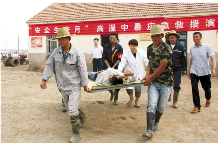
为了加强公司全员的安全预防意识,增强应对紧急事件的自我保护和防卫能力,日前,灌西投资公司在灌西制盐分公司九班联合举行“高温中暑应急救援演练”活动,各单位分管安全负责人、日晒制盐一线班组长40余人参加观摩。(季兴胜)