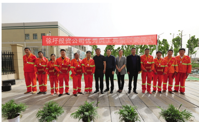
5月12日下午,徐圩投资公司举行三类“优秀员工”颁奖仪式,本次颁奖分设机关、悦升班组休息点、马二份生产单元三个会场,分别对星级、金牌、首席共17名三类“优秀员工”进行颁奖。(茹莹)

习习的风拂着细细的雨,万物生机盎然。徜徉其中,庆祝我们存在于这个时节,致敬生命、致敬劳动者。