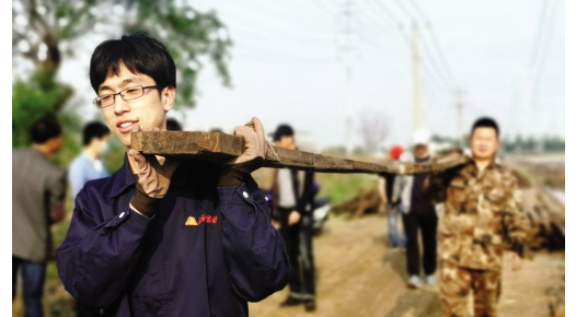
5月16日,周六上午,台北公司组织18位青年员工放弃休息日,到大浦工区先锋滩协助灌池工作。酷暑汗雨挡不住青年同志的激情,仅用半天时间就完成了1600米浮板的安装工作。(韩挺)