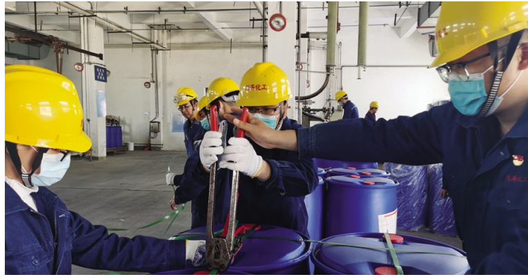
因仓储中心包装人手短缺,为确保外销订单及时顺利交货,近日,利海化工公司成立由党员、入党积极分子和团员青年共14人组成的突击队,到仓储包装生产线开展突击服务。经过近3个小时的忙碌,将16吨外销产品包装完毕。(孙璐璐)