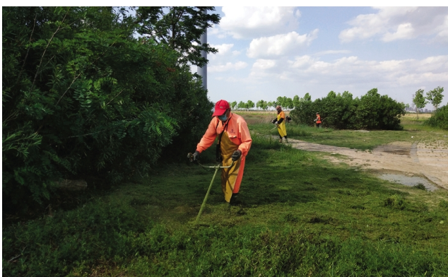
华茂绿化工程公司围绕“创文”新要求新任务,紧抓当前绿化养护的“黄金”季节,加大辖区绿化苗木、花坛、草坪等管养力度。图为绿化工人在开发区调尾河东岸绿化“边缘地带”打理草坪。(张青松)