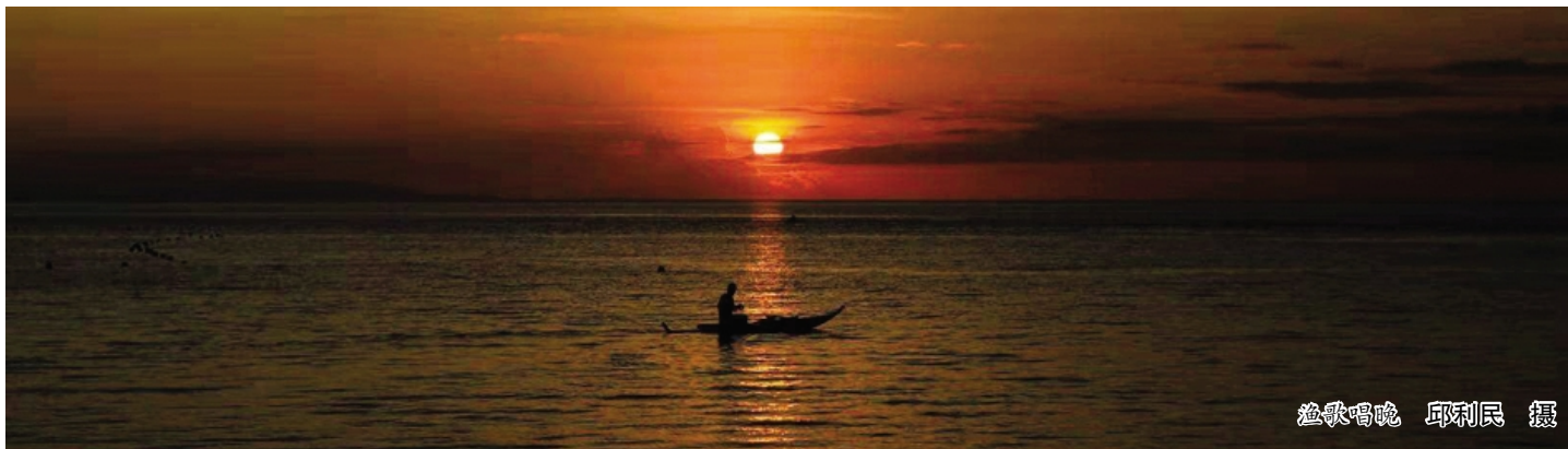
渔歌唱晚