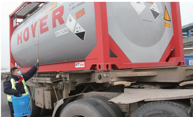
1月27日,利海化工公司出口产品返空罐回港,该公司严格执行疫情防控相关程序,提前申报相关部门备案,在港口接罐后对槽罐进行彻底消杀,抵达公司厂门外做好登记,再次对返空罐轮胎、罐体等进行全方位消杀后方可入厂灌装产品。(郁洪兵 梁娟)

园区经济再升级。新承接开发区灯笼维护、公交站台维护、管道迁移、绿化土回填等多项市政工程,收入100万元,实现单月过百,走出了一条差异化发展道路。园区服务再升级,把打造省级创业示范基地、省级留学人员创业园、国家级公共服务平台、国家级众创空间和孵化器作为重点,做实做细各项申报工作。同时精准服务企业,加快园区升级,进一步完善园区空间规划,明晰园区发展产业定位。(北宣)