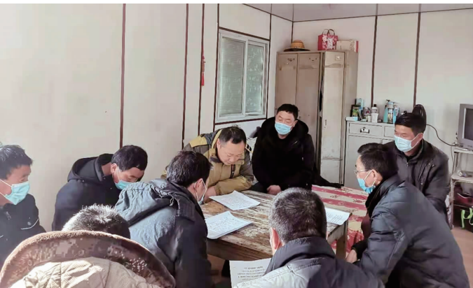
连日来,徐圩投资公司贯彻落实《新时代“连云港精神”宣传工作方案》学习要求,各级党组织深入一线班组召开学习新时代“连云港精神”学习讨论会,让“连云港精神”在班组落地生根,为完成2021年各项目标任务统一思想、凝聚合力。(刘永 陈健)