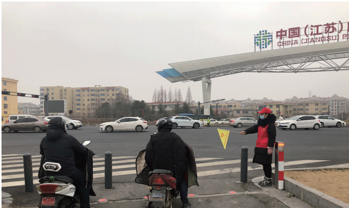
1月21日,华茂绿化工程公司积极开展“美德之城,温暖新春”爱心斑马线志愿服务活动。上午7时许,花果山大道与港城大道交叉路口正值上班高峰,志愿者们在现场进行指挥协调疏导,纠正制止行人闯红灯、越线停车等违规行为,耐心引导行人遵守交通规则。(杨园园)