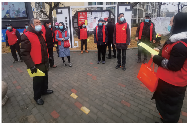
在台北投资公司职工小区中,有这样一群台北退休支部书记组成的“老年防疫天团”,他们平均年龄在三十年以上,主动参与小区门口检查工作,协助物业登记来往人员信息,同时发放“防疫一封信”,向小区住户讲解防疫知识,分发口罩。(毛艾青)