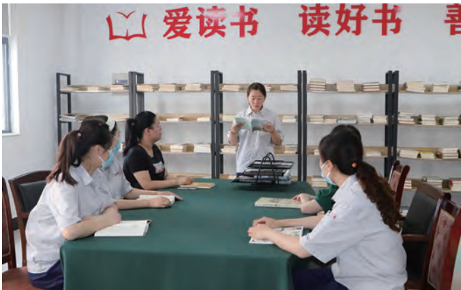
为积极响应市第十三届“职工读书月”活动号召,7月27日,神特新材料公司开展职工读书交流活动,邀请职工代表作为领读人,结合成长经历,分享阅读感悟,影响带动身边人,把学习成果转化为前行力量。(神特宣)