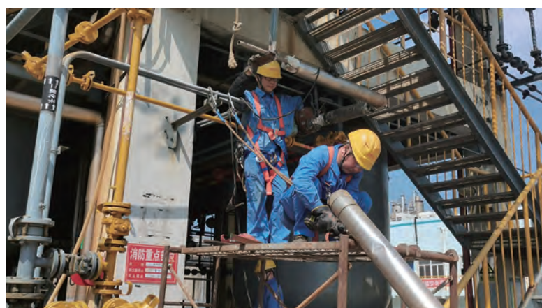
7月21日,利海化工公司开始为期10天的夏季装置大修工作。此次大修共执行60余项检修和技改项目,将显著改进装置设备运行状况,提高工艺水平和安全运行水平。图为维保人员在调整管道。

制定行动方案。各基层单位为主体,制定实施方案,统筹抓落实。明确工作重点,明确责任分工,明确推进措施,确保上下联动,形成合力。