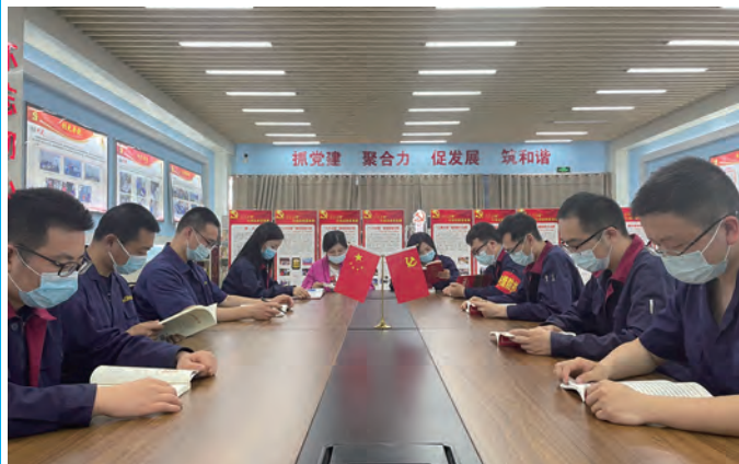
今年以来,氨纶公司工会重点围绕“以理想信念教育职工,以先进文化感染职工”为导向,紧抓职工书屋的建设、管理、使用,突出打造职工阅读新体验、新品牌。图为青年职工开展品读会活动。