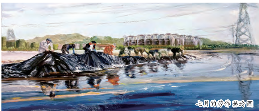
七月的劳作 苏玲画

阅读使人增长见识，开拓眼界，读完一本优秀的书籍能够让人的心灵得到洗涤，思想得到升华。近日我读了小说《追梦》，深深地被故事情节所吸引，作者所传达出来的积极向上的人生观以及在信念中摸索前行，追求理想和美好生活的人生态度，带给我深刻的反省和积极影响。