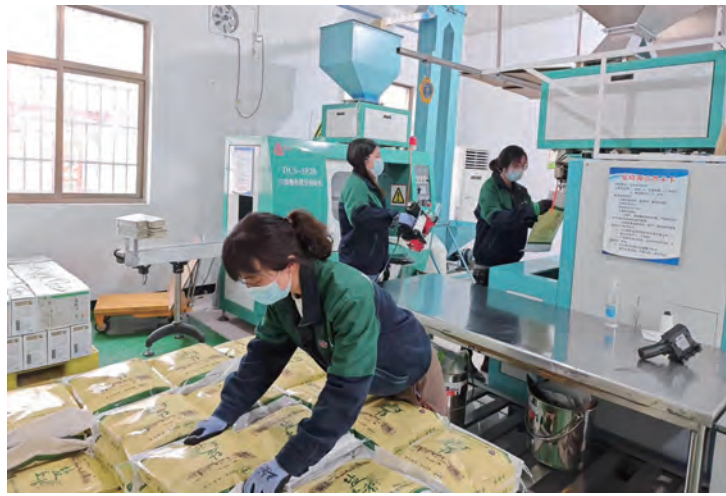
节后复工复产以来,青口投资公司聚焦项目提速、生产提质、保障提升,开足马力以实干拼实绩,为夺取首季“开门红”提供源源不断的动力。图为米业营销中心生产线全速运转,实现开工即满产。

凝心聚力齐上阵。伴随着冲刺首季“开门红”的号角,各生产班组激战正酣,各产业板块充分发挥主观能动性,在全公司上下全面掀起“提质增效创佳绩、强链扩规建新功”劳动竞赛活动热潮。通过生产攻坚、技术攻关等多种竞赛形式,强化职工的争先意识、创新意识和效益意识,解决企业生产、安全、技术、质量、环保等方面的“卡脖子”问题,以赛促学、以赛促创、以赛促能,营造“比学赶超”的良好氛围,合力画好“同心圆”。(许彦彦)