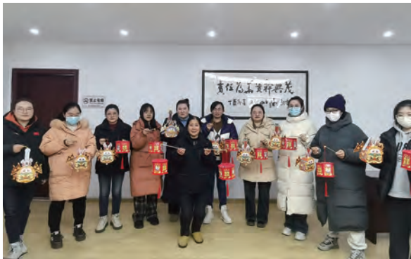
元宵节前夕,为弘扬中华优秀传统文化,台北、华茂公司女工委组织开展“巧手做灯笼 喜迎元宵节”活动,增强女职工的文化自信,加强交流与合作,提升团队凝聚力。(北工)