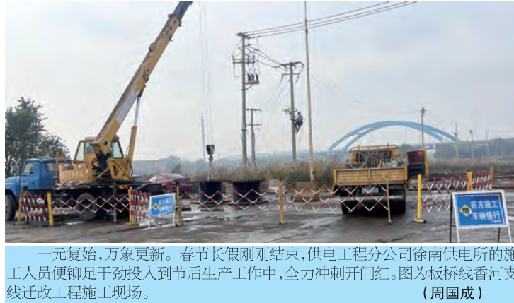
一元复始,万象更新。春节长假刚刚结束,供电工程分公司徐南供电所的施工人员便铆足干劲投入到节后生产工作中,全力冲刺开门红。图为板桥线香河支线迁改工程施工现场。(周国成)