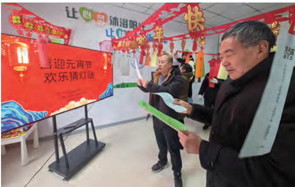
为充分展示传统民俗节庆的内涵魅力,促进社企共建合作,营造喜庆、文明、祥和的元宵节气氛,近日,青口投资公司生产生活服务中心分会联合黄沙坨社区共同开展了做花灯、猜灯谜活动。(田盛楠)

岗位创新活动递增高质发展活力。鼓励劳模先进带领团队立足企业生产经营的前沿阵地,不遗余力地发挥聪明才智,源源不断释放创新能量;开展“劳模与我同行”“我身边的工匠”宣教活动,用先进事迹感染职工,带领更多职工“学习劳模、争当先进”;发挥示范引领作用,鼓励职工大胆创新、大胆突破,造就一支高素质的产业工人队伍。(神特宣)